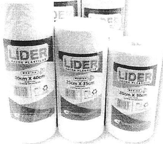
Bobina Picotada Líder Quilo.