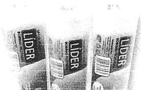
Bobina Picotada Líder Unidade.